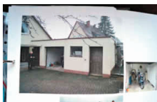
Die Garage vor ihrem Umbau.

Ursprung Trockenbau, Riegelsche Baustoffe, Frankenberger Baustoffe, Energieversorgung Miltenberg-Bürgstadt, aus Bürgstadt: Firma Maimmettal, Hehner Raumausstattung, Fieson Center Ottel GmbH, Jung & Schmitt GmbH. Darüber hinaus: E-Küchensdesign (Weilbach), Rauch Möbelwerke (Freudenberg), Sprinz Sanitex (Büttelborn), Wirf Elektrotechnik (Kleinheubach), Elektro Braun (AB), Kaffeegeschäft A. Karl (Rottendorf), Vereinigte Spezialmöbelfabriken (Tauberbischofsheim), Breiting AG (Aschaffenburg), Lunos Lüftungstechnik (Berlin), Aktionsfelder (Mainschaff), Baudienstleistungen Unterrmann (Großheubach), Baustoffhandel Knapp (Großheubach), Bauleitung Architekturbüro Knapp und Kubitzka (Kleinheubach). (rea)