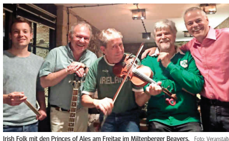
Irish Folk mit den Princes of Ales am Freitag im Miltenberger Beavers.

Auftritte der Princes überzeugen laut Ankündigung des Veranstalters durch puren Spaß an