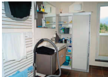
Das Bad: funktional und modern.